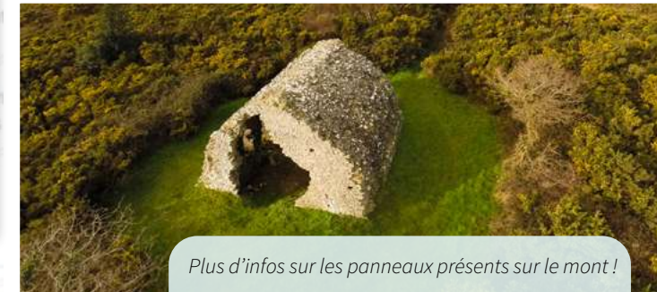
Plus d'infos sur les panneaux présents sur le mont !

3 Le corps de garde Ce bâtiment militaire, construit au XVII e siècle, servait autrefois à la surveillance des côtes du Cotentin face aux Anglais des îles voisines, ennemis historiques de la France. C'est la raison pour laquelle l'édifice dispose de grandes baies ouvertes sur la mer.