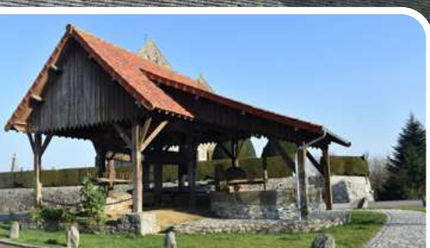
Le vieux pressoir et le tour à piler