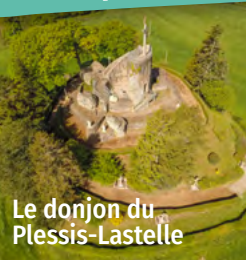
Le donjon de Plessis-Lastelle