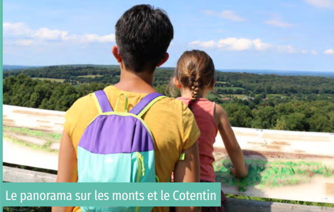
Le panorama sur les monts et le Cotentin