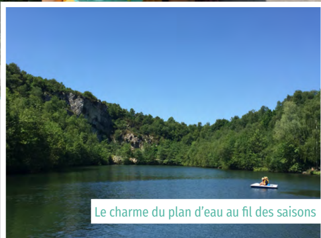
Le charme du plan d'eau au fil des saisons