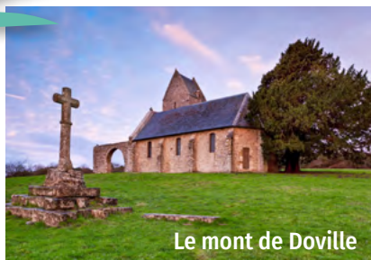
Le mont de Doville