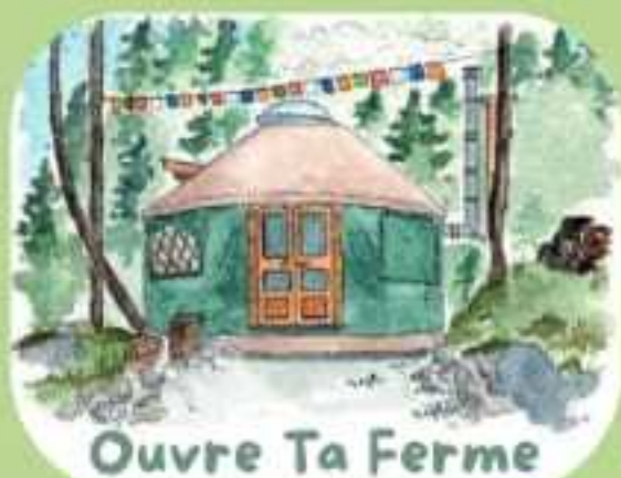
Ouvre Ta Ferme